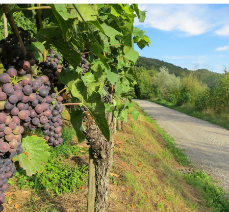
Im Herbst locken die vielen Farben nach Eglisau.

Drachenbootrennen Eglisau, 043 810 73 1,