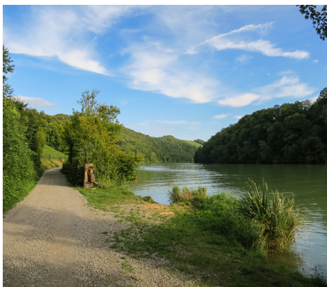
Im Herbst ist es etwas ruhiger am Rheinufer.